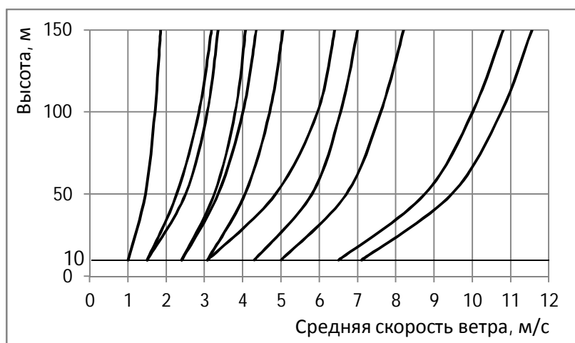
Рисунок 3 – Средние скорости ветра для различных мест в зависимости от высоты

Для малых ВЭУ, размещаемых во внутренних районах (вдали от морей) минусом является то, что они располагаются на небольших высотах, а значит, находятся в ветровом потоке низкой плотности по сравнению с крупными ВЭС (рисунок 3) [7].